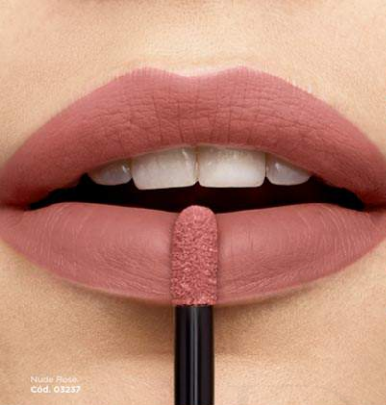
Nude Rose Cód. 03237