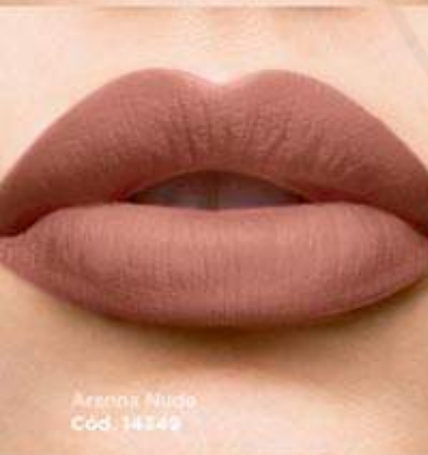
Aréna Nude Cód. 14349