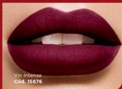
Vin Intense Cód. 15676