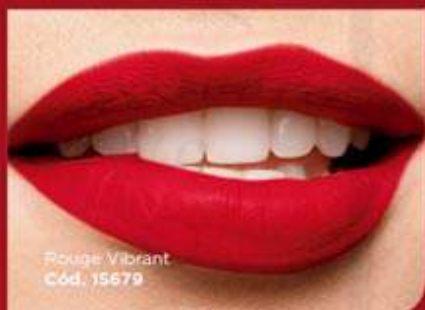
Rouge Vibrant Cód. 15679