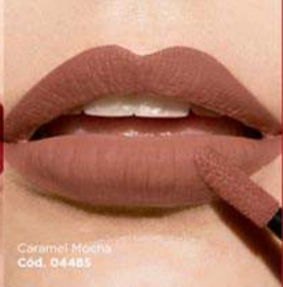
Caramel Mocha Cód. 04485