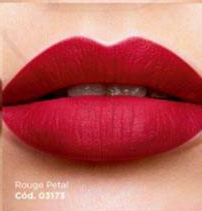
Rouge Petal Cód. 03173