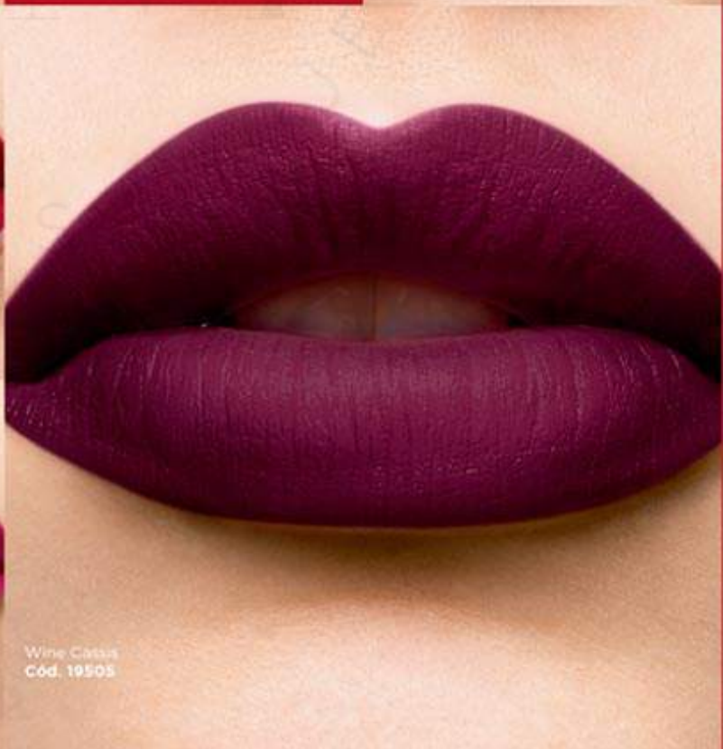
Wine Cassis Cód. 19505