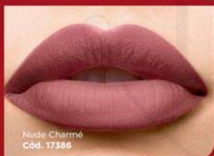
Nude Charmé Cód. 17386