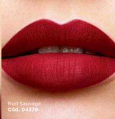
Red Sauvage Cód. 04379