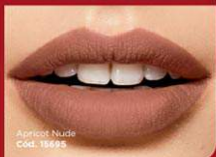
Apricot Nude Cód. 15695