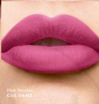
Pink Nouveau Cód. 04413