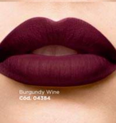
Burgundy Wine Cód. 04384