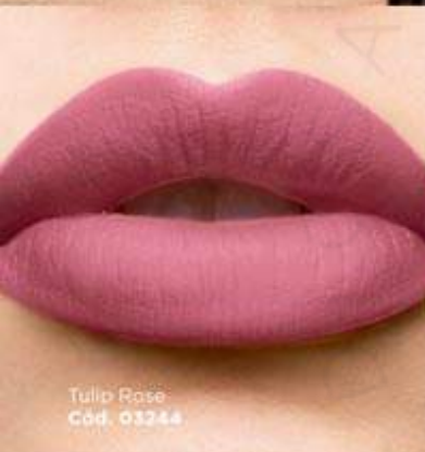
Tulip Rose Cód. 03244