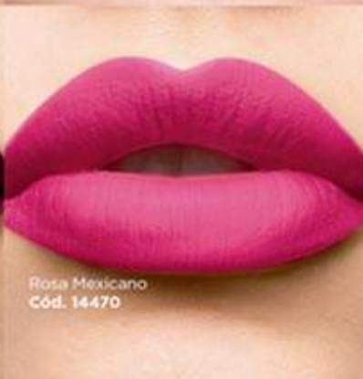
Rosa Mexicano Cód. 14470