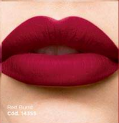
Red Burnt Cód. 14385