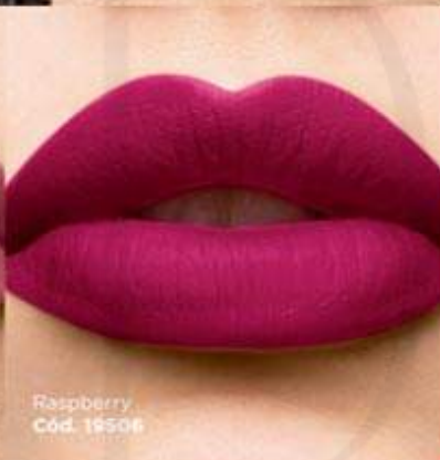
Raspberry Cód. 19506