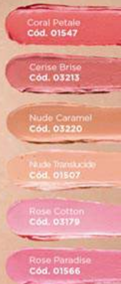
Coral Petale Cód. 01547