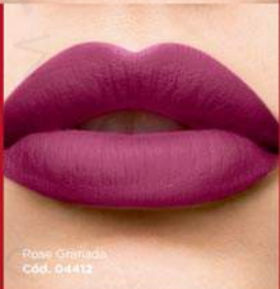
Rosa Grenada Cód. 04412