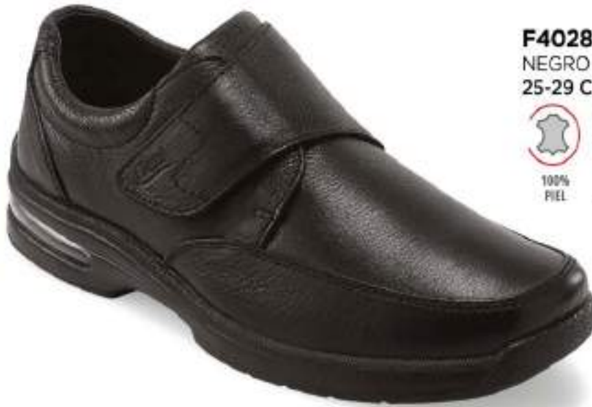
F40280 NEGRO | 25-29 CON MEDIOS