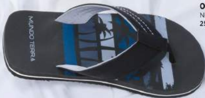
035 243 NEGRO | 25-30 ENTEROS