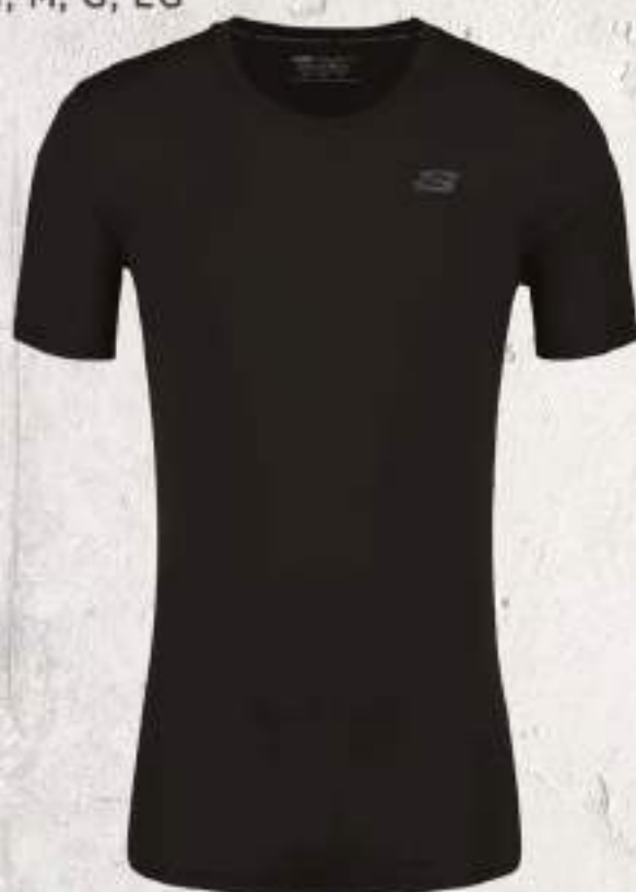
SBMX00 | NEGRO CH, M, G, EG