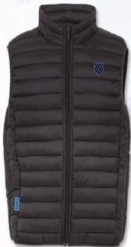
KCBRON CHALECO | NEGRO CH, M, G, EG