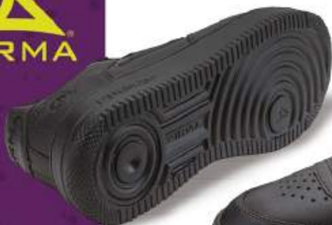
PB5002 NEGRO | 25-30 ENTEROS