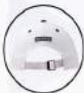
K13171 BLANCO | ÚNICA