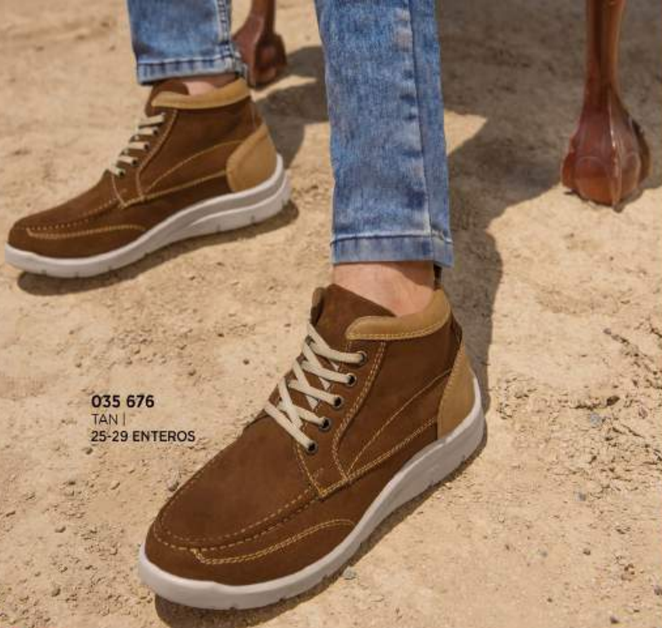
035 676 TAN | 25-29 ENTEROS