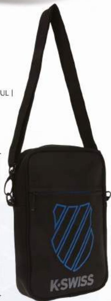
KFRED2 NEGRO-AZUL | ÚNICA