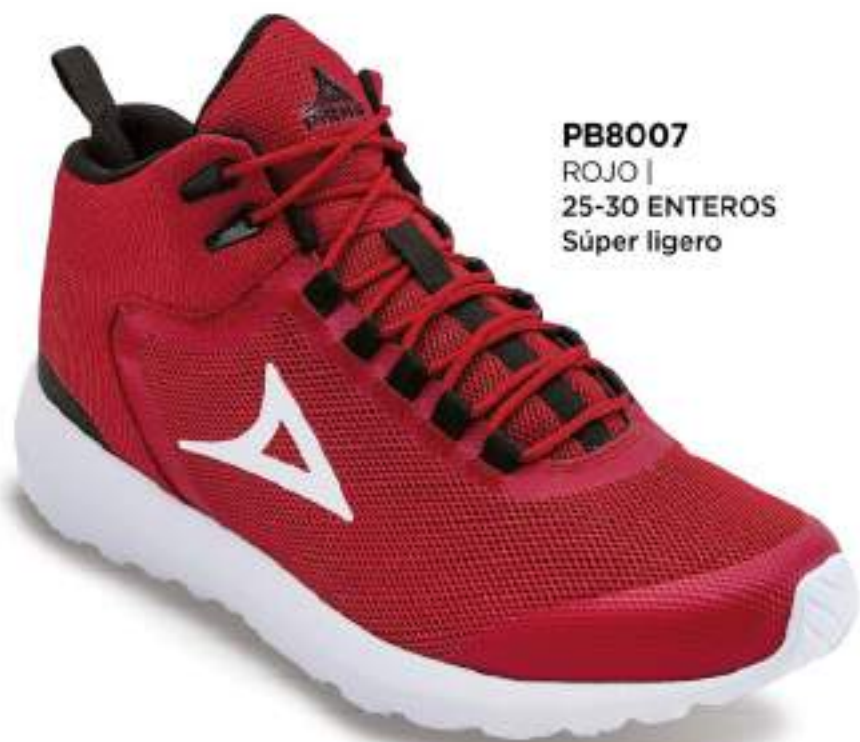
PB8007 ROJO | 25-30 ENTEROS Súper ligero