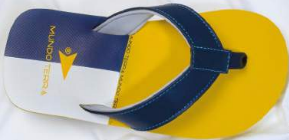
035 625 MARINO | 25-29 ENTEROS