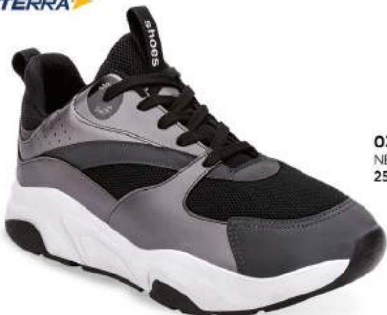
032 340 NEGRO-GRIS | 25-29 ENTEROS