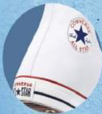
VM1301 NEGRO | ÚNICA