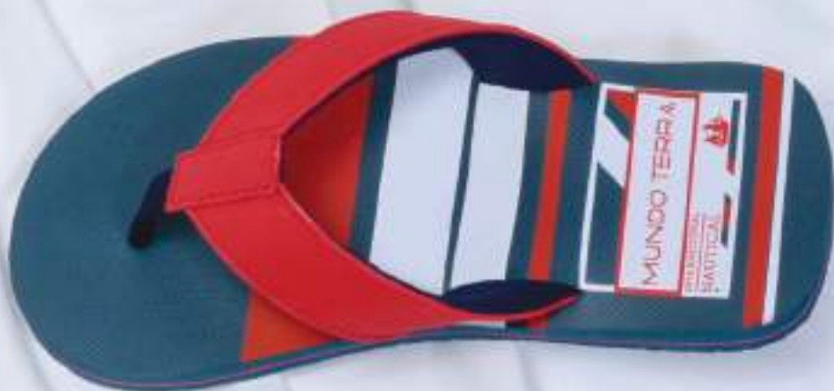
035 612 ROJO | 25-29 ENTEROS