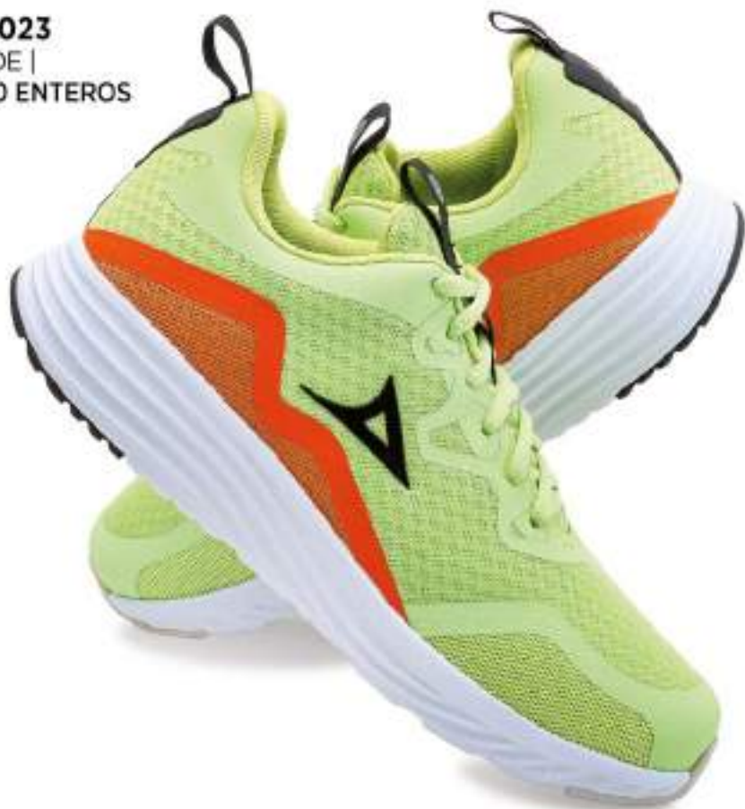
PB4023 VERDE | 25-30 ENTEROS