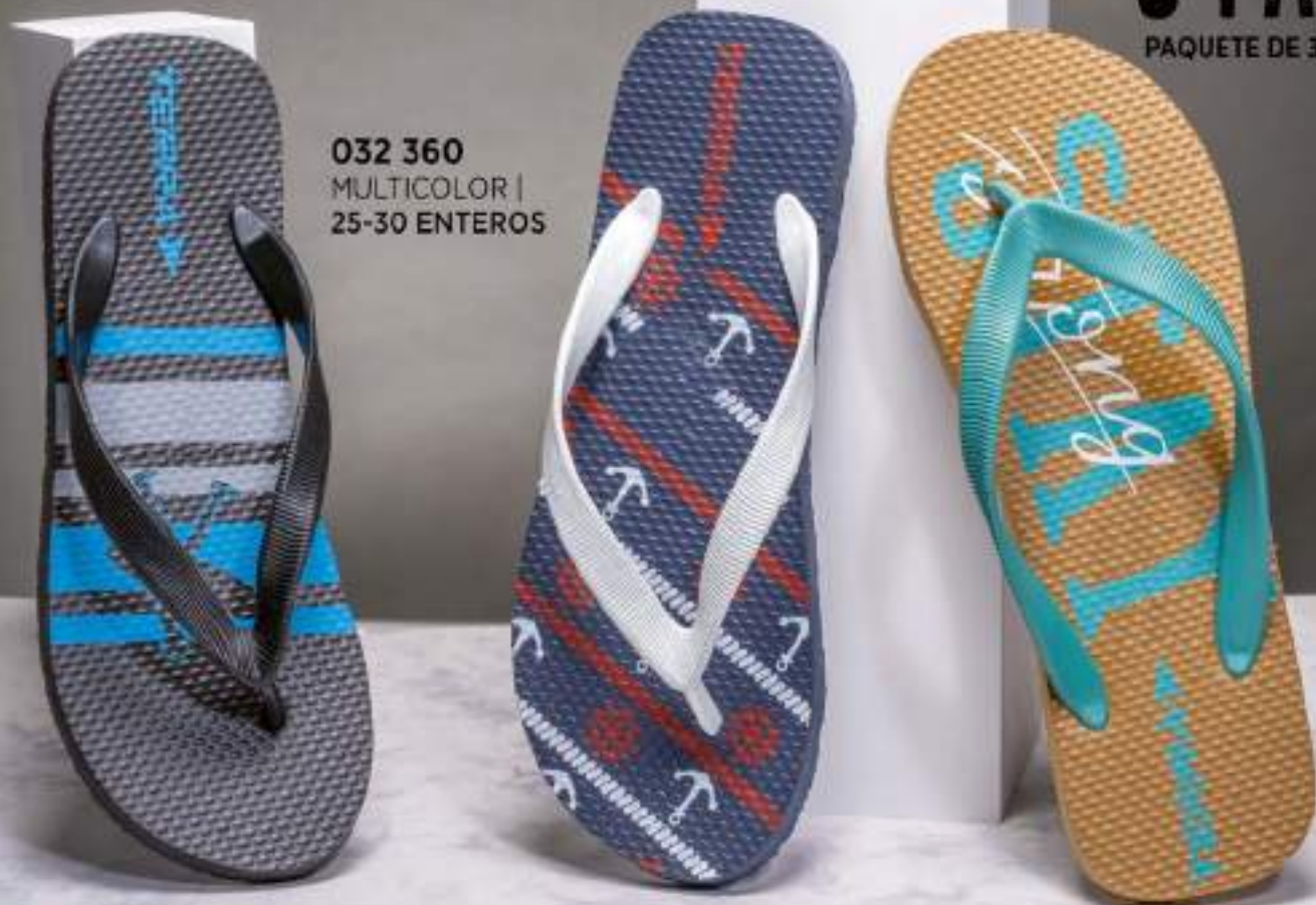
032 360 MULTICOLOR | 25-30 ENTEROS