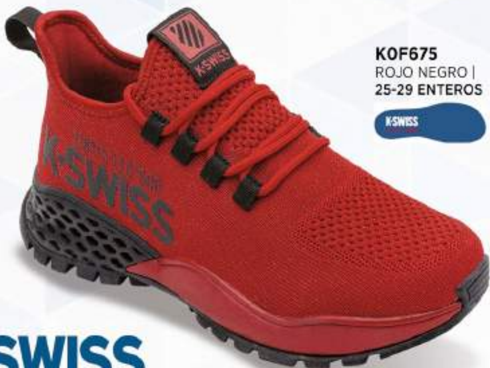
KOF675 ROJO NEGRO | 25-29 ENTEROS