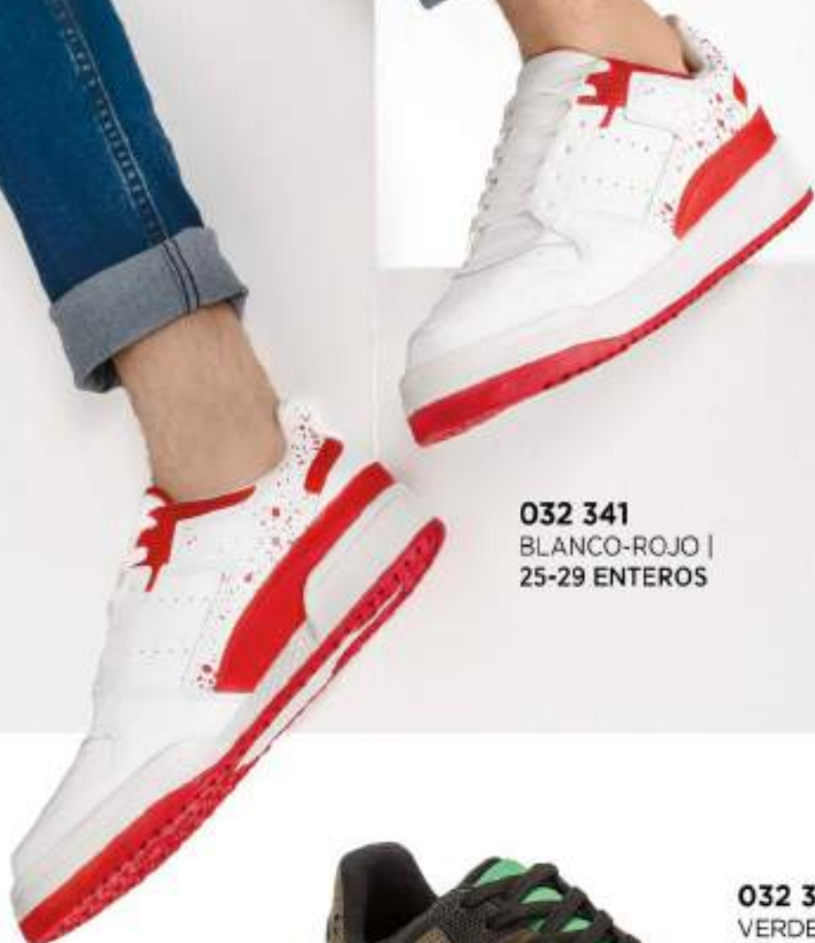
032 341 BLANCO-ROJO | 25-29 ENTEROS