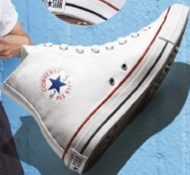
VM7650 BLANCO | 23-29 CON MEDIOS