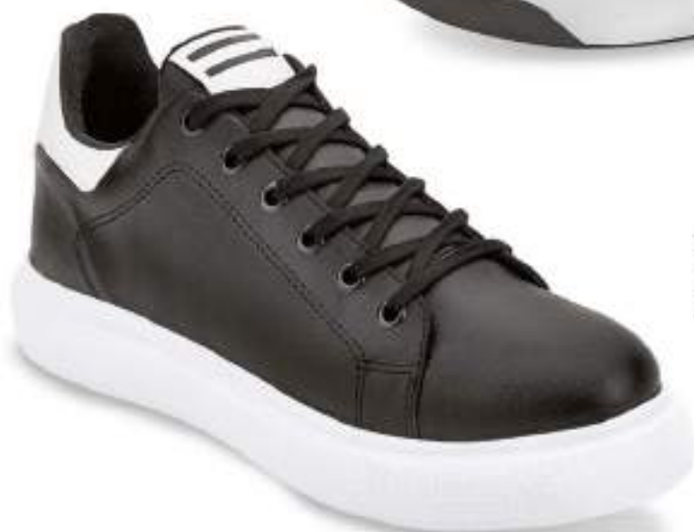
034 682 NEGRO-BLANCO | 25-29 ENTEROS