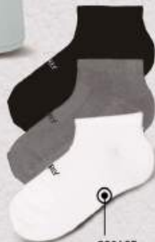
C80465 Multicolor Talla única Paquete, 3 pares