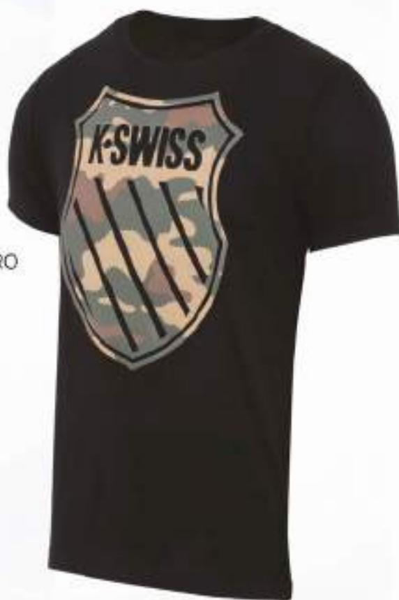
KGUILE PLAYERA | NEGRO CH, M, G, EG