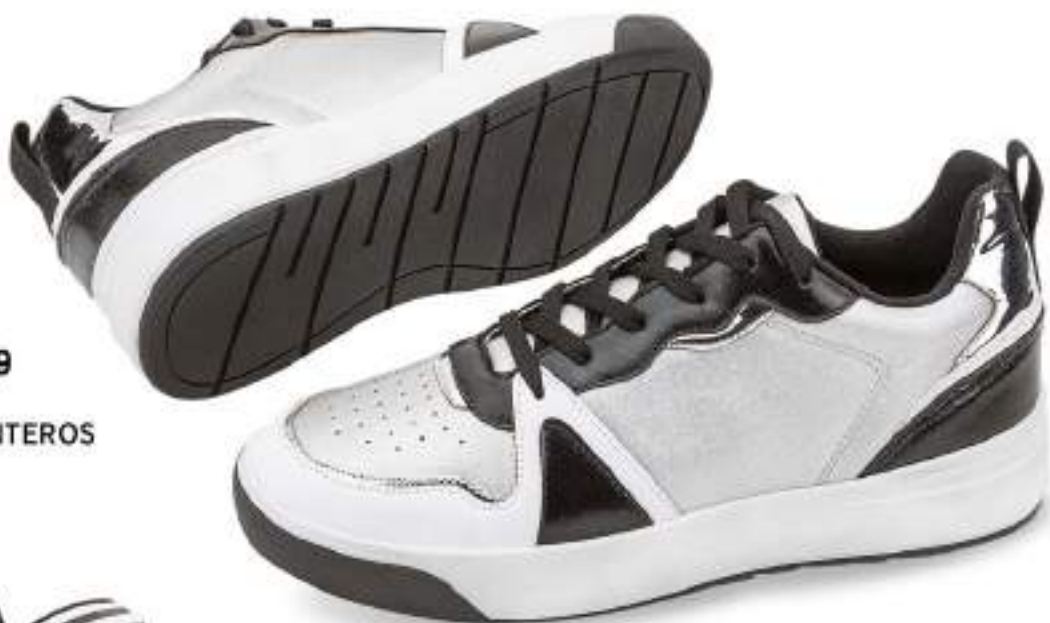
032 339 PLATA | 25-29 ENTEROS