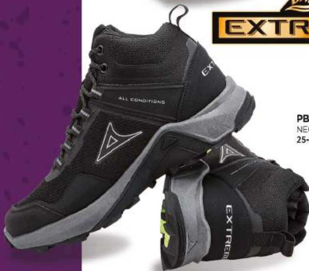
PB1308 NEGRO | 25-29 ENTEROS