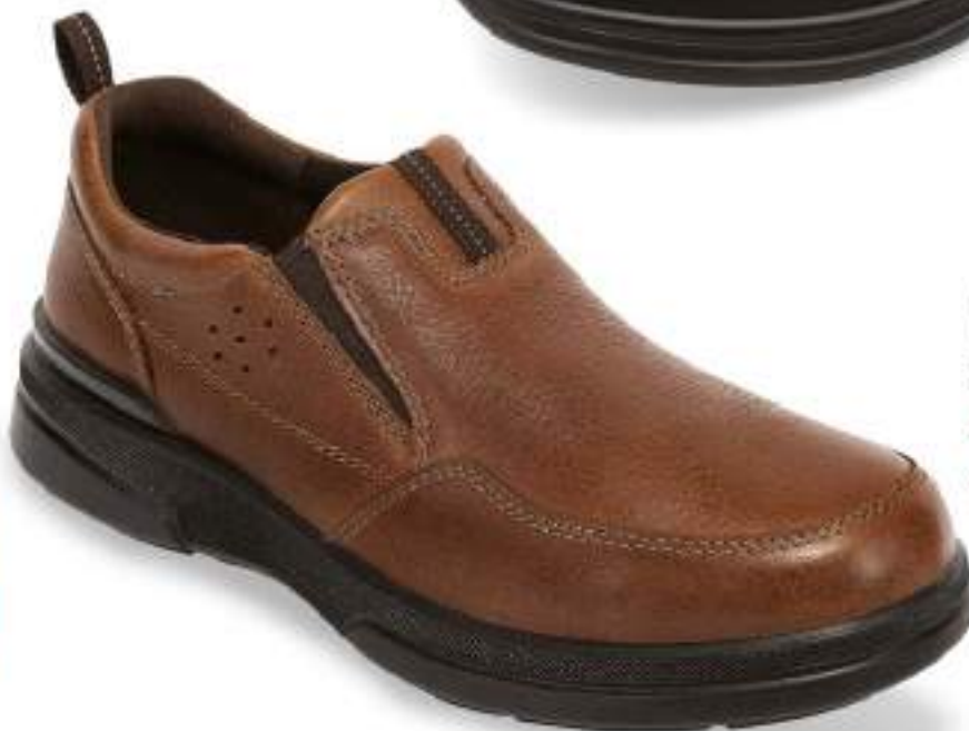
F41060 TAN | 25-29 CON MEDIOS