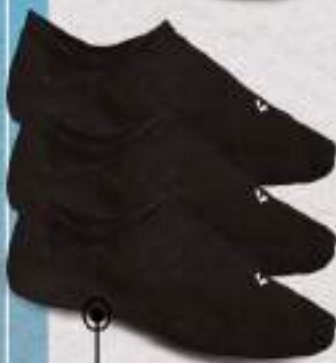
C80462 Negro Talla única Paquete, 3 pares