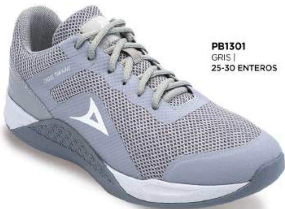
PB1301 GRIS | 25-30 ENTEROS