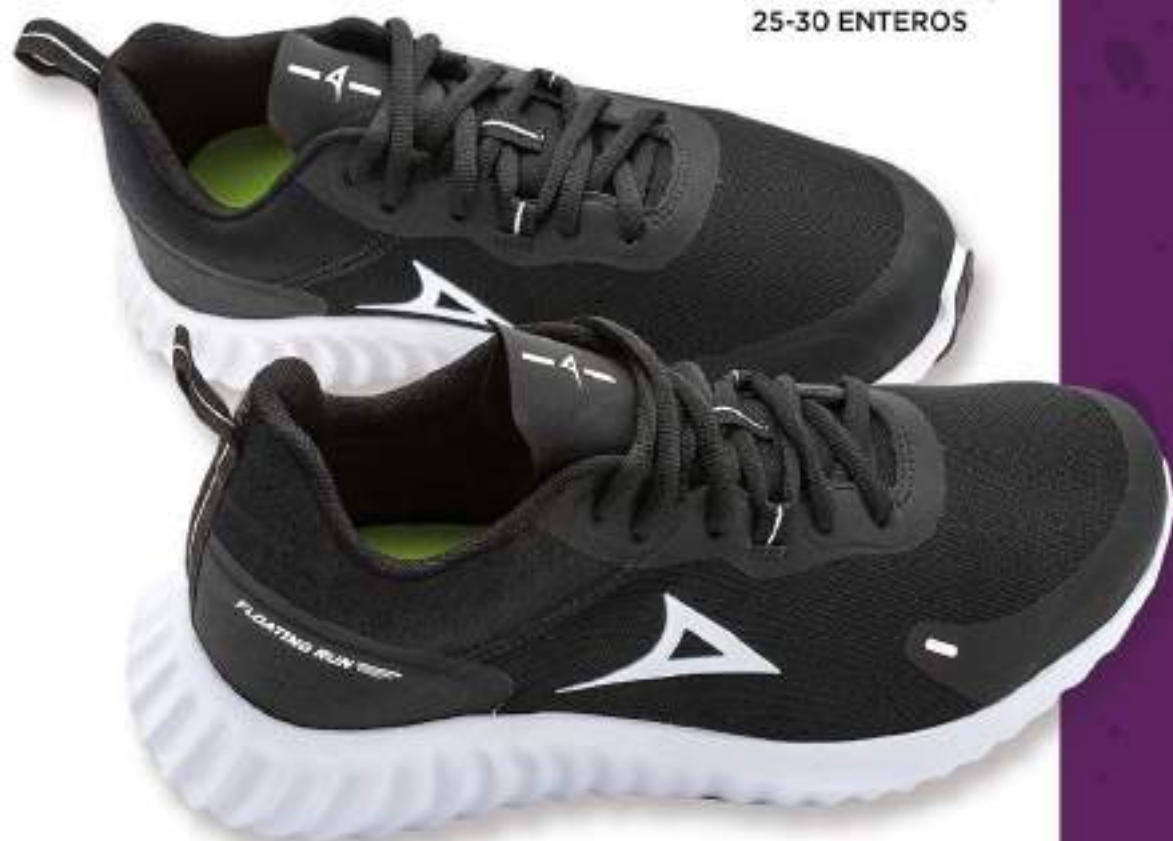
PB4005 NEGRO-BLANCO | 25-30 ENTEROS