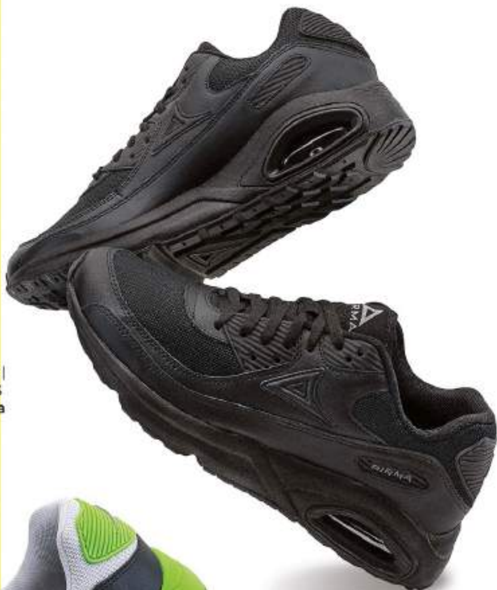
PB5044 NEGRO NEGRO | 25-30 ENTEROS Burbuja en Suela