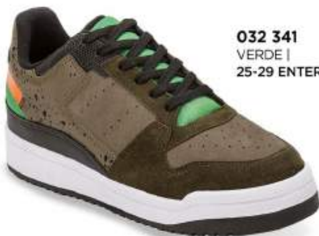
032 341 VERDE | 25-29 ENTEROS