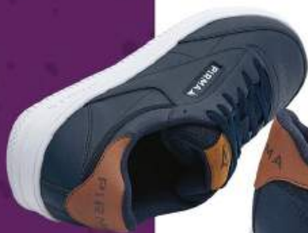
PB5051 MARINO | 25-29 ENTEROS