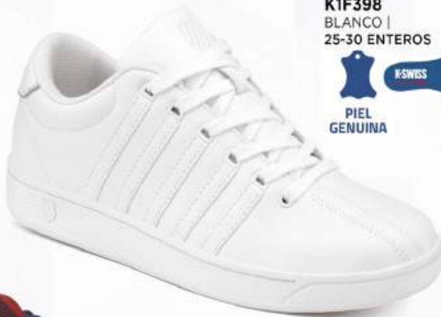
K1F398 BLANCO | 25-30 ENTEROS