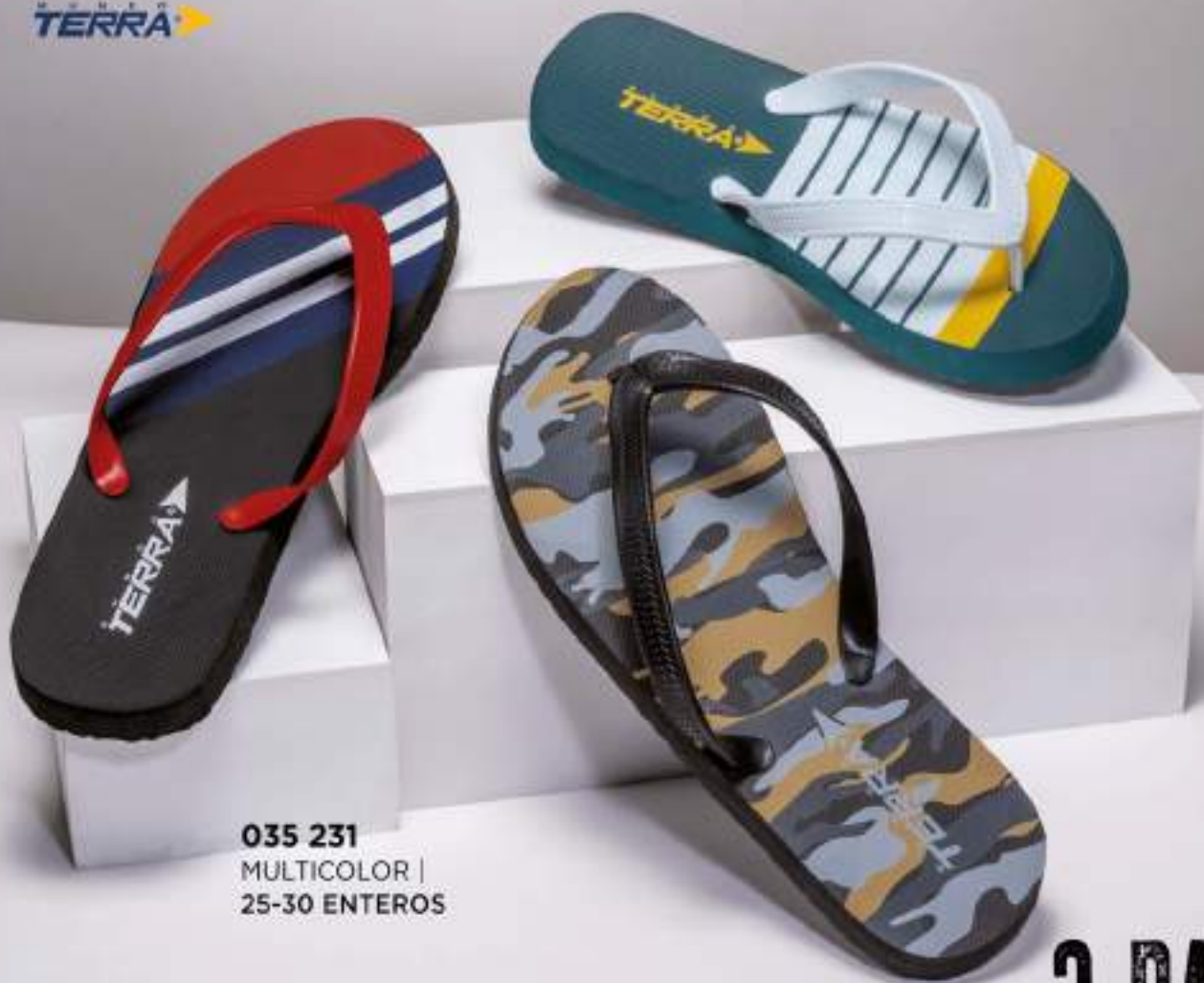
035 231 MULTICOLOR | 25-30 ENTEROS