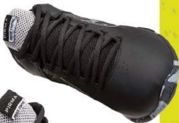
PB0795 NEGRO-GRIS | 25-30 ENTEROS