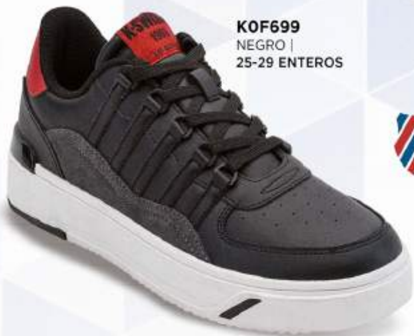
KOF699 NEGRO | 25-29 ENTEROS