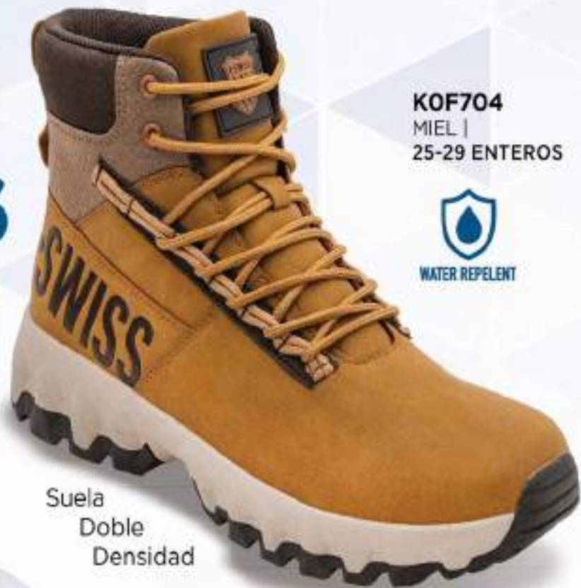
KOF704 MIEL | 25-29 ENTEROS