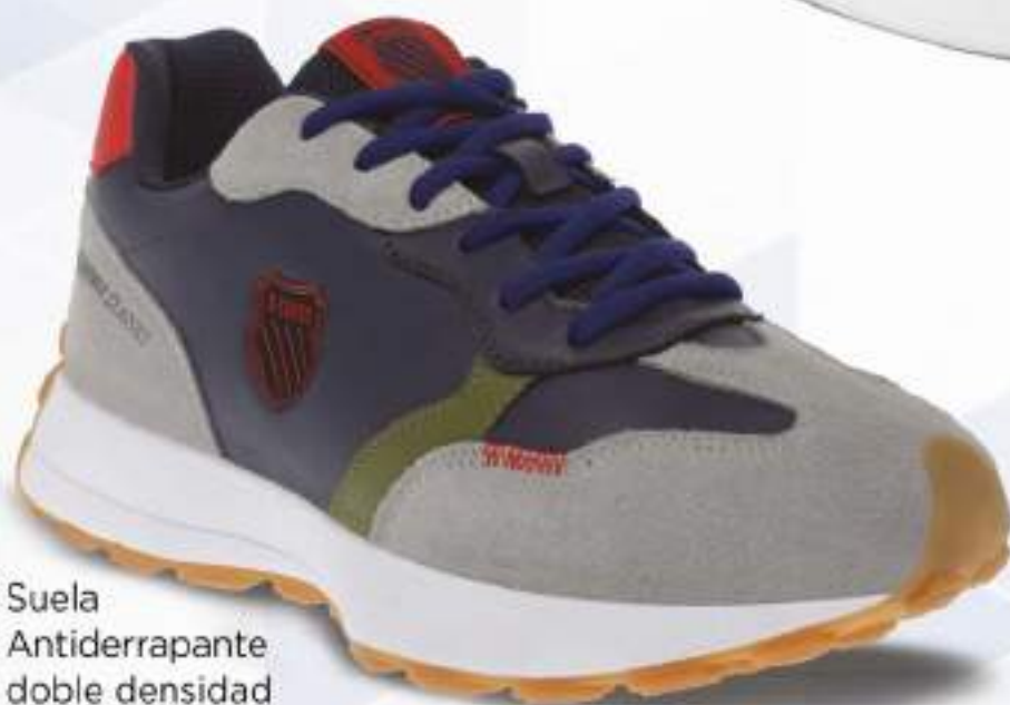
KOF700 MARINO | 25-29 ENTEROS