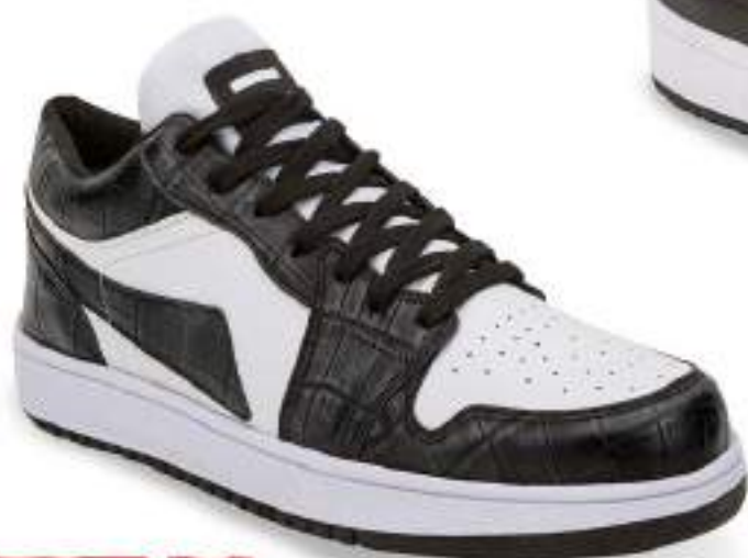
034 681 BLANCO-NEGRO | 25-29 ENTEROS