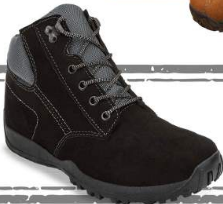
034 573 NEGRO | 25-29 ENTEROS