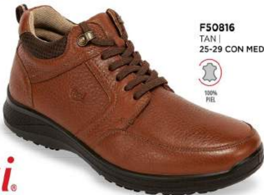
F50816 TAN | 25-29 CON MEDIOS