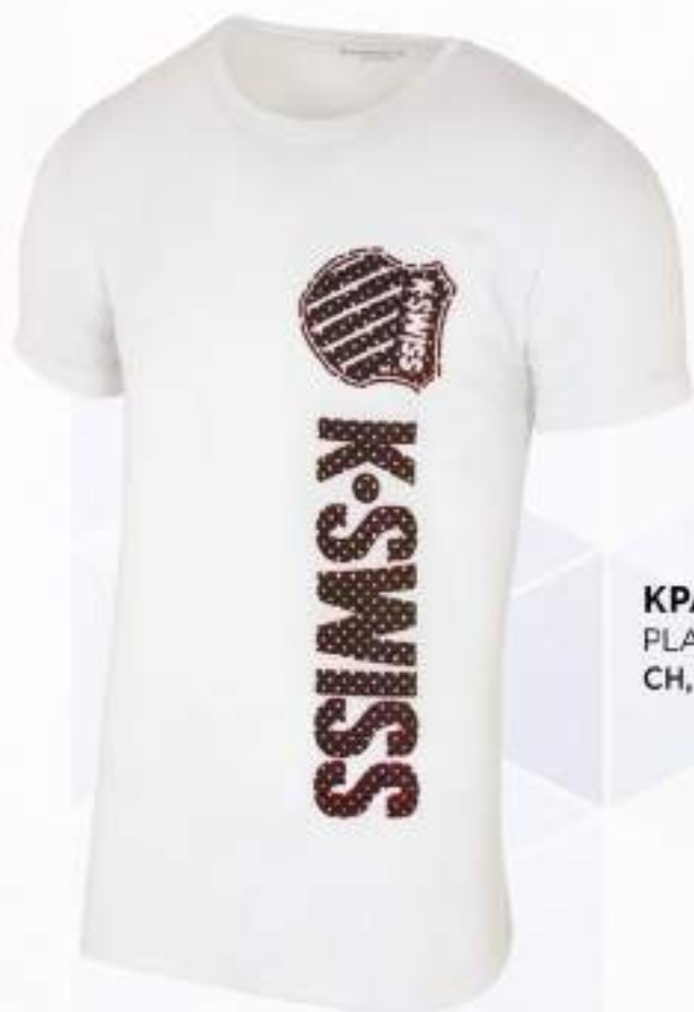
KPANEL PLAYERA | BLANCO CH, M, G, EG