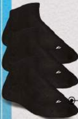
C04648 Negro Talla única Paquete, 3 pares