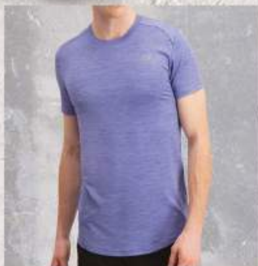
SX079L | LAVANDA CH, M, G, EG