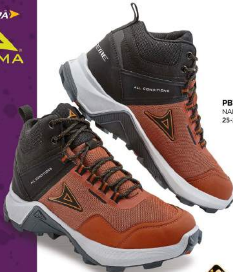
PB1308 NARANJA | 25-29 ENTEROS