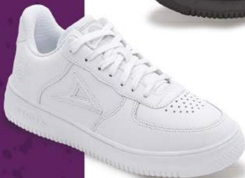
PB5002 BLANCO | 25-30 ENTEROS