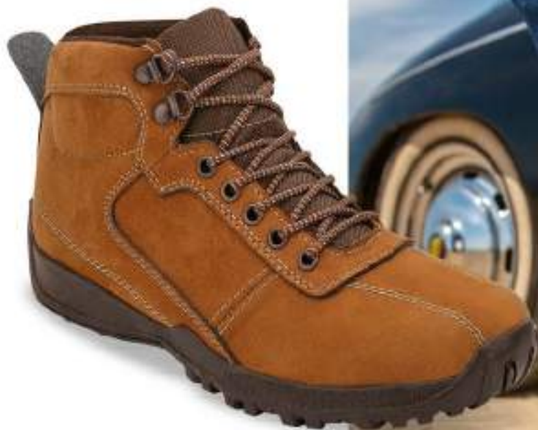
034 574 TAN | 25-29 ENTEROS