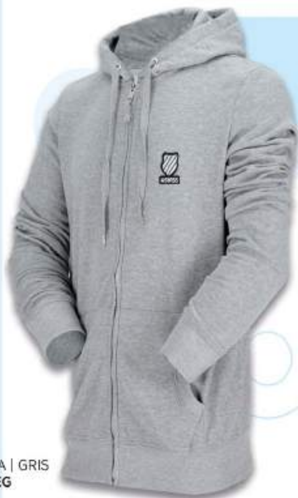
KSDJAS SUDADERA | GRIS CH, M, G, EG