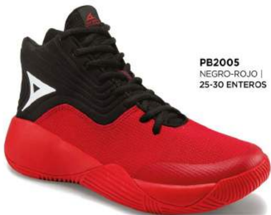
PB2005 NEGRO-ROJO | 25-30 ENTEROS