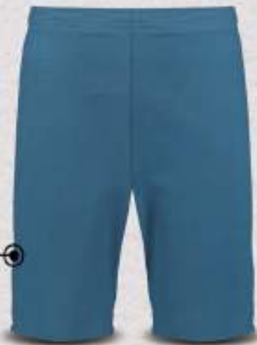
C50283 Azul CH, M, G, EG