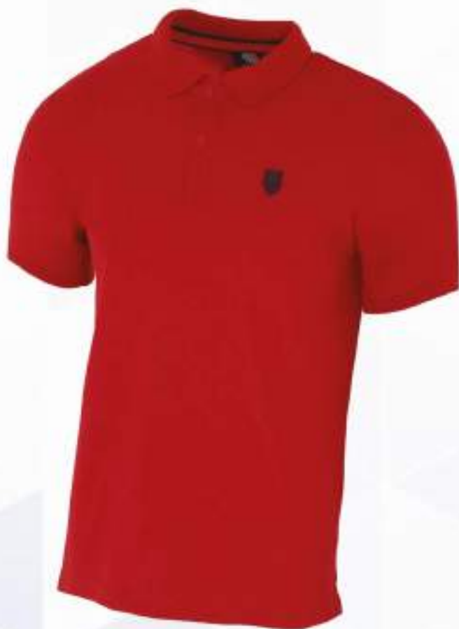
KPZORC POLO | ROJO CH, M, G, EG