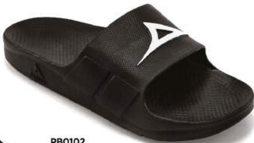
PB0102 NEGRO | 25-30 ENTEROS