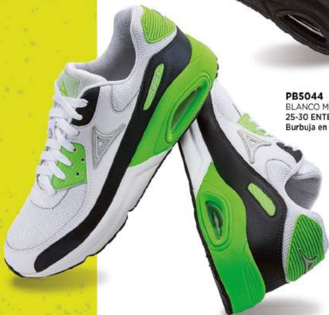
PB5044 BLANCO MULTI | 25-30 ENTEROS Burbuja en Suela