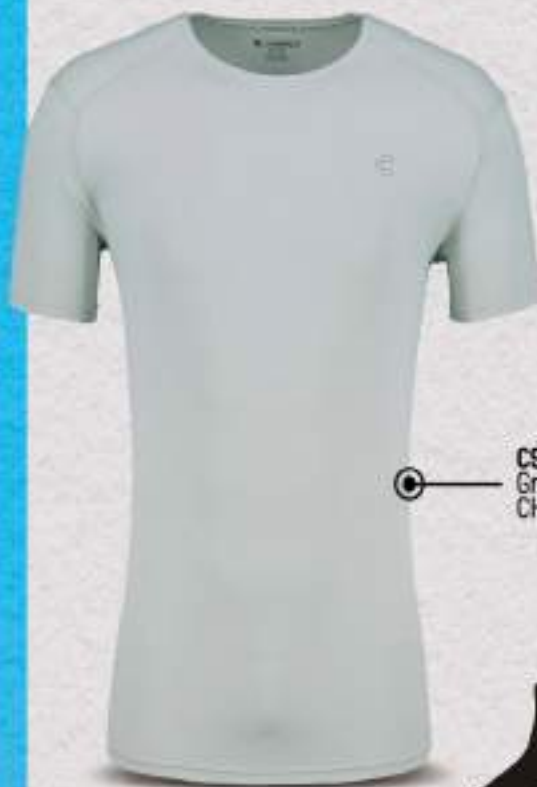
C95081 Gris CH, M, G, EG