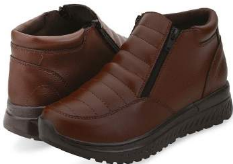
038 999 CAFÉ | 25-29 ENTEROS