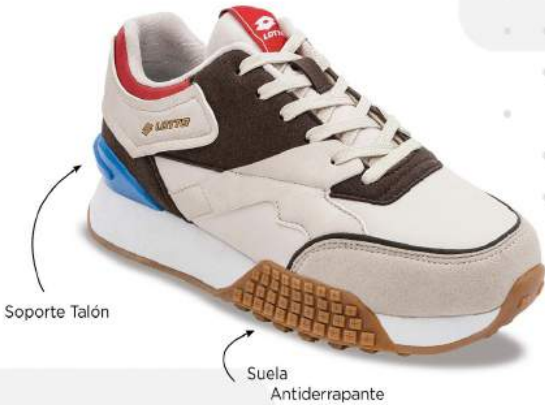
LOH466 ARENA, NEGRO-ROJO | 25-28 ENTEROS